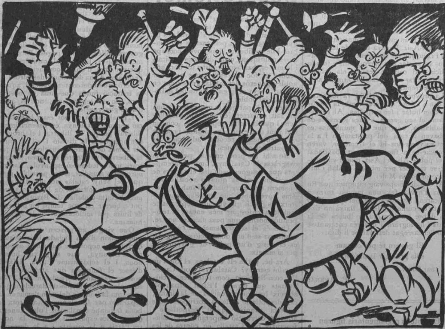
De la discussió en surt la llum