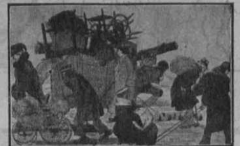
El problema de la circulació

bé comú, obliguen que els homes no siguin camèlics i per lo tant, cada qual té de transportar-se el seu parcellet. Carruatges no en parlem. Menys que's tracti d'un matrimoni o d'una parella ben avinguda que l'arrocegui una estona cada u, s'ha d'anar a peu si us plau per força. Però si les causes són diferents, els efectes són iguals. I el cas és que tant aquí, com a Moscou o Petrograd, el transport mecànic o més o menys animal és un cuento , que tant aquí com allí, els ben acostumats han hagut de sapiguer lo que és portar paquets a l'esquena i ésser roda camins.