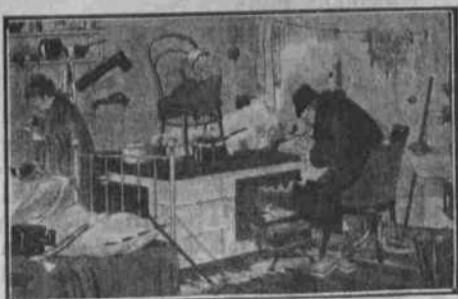
Un interior burgès a Petrograd

Qui no s'aconhorta, és perquè no vol, axioma sapigut i molt cert. Si fos a Barcelona sol on es fomenta la barracòpolis, fora cas de queixar-se i posar el crit al cel o allí on fos. Però no. Mireu arreu, i per tot el mateix espectacle. Fins a Rússia, fins allí on, segons la premsa, ha mort afusellada la meitat de la població, manquen pisos. Sort dels afusellaments, sinó hi hauria hagut la revolució dels llogaters.