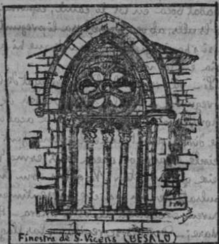
Finestra de S. Vicens (BESALU)

— Tot també — feu ell tot encament lo cigarro — y per cert qu'hi presenciat una