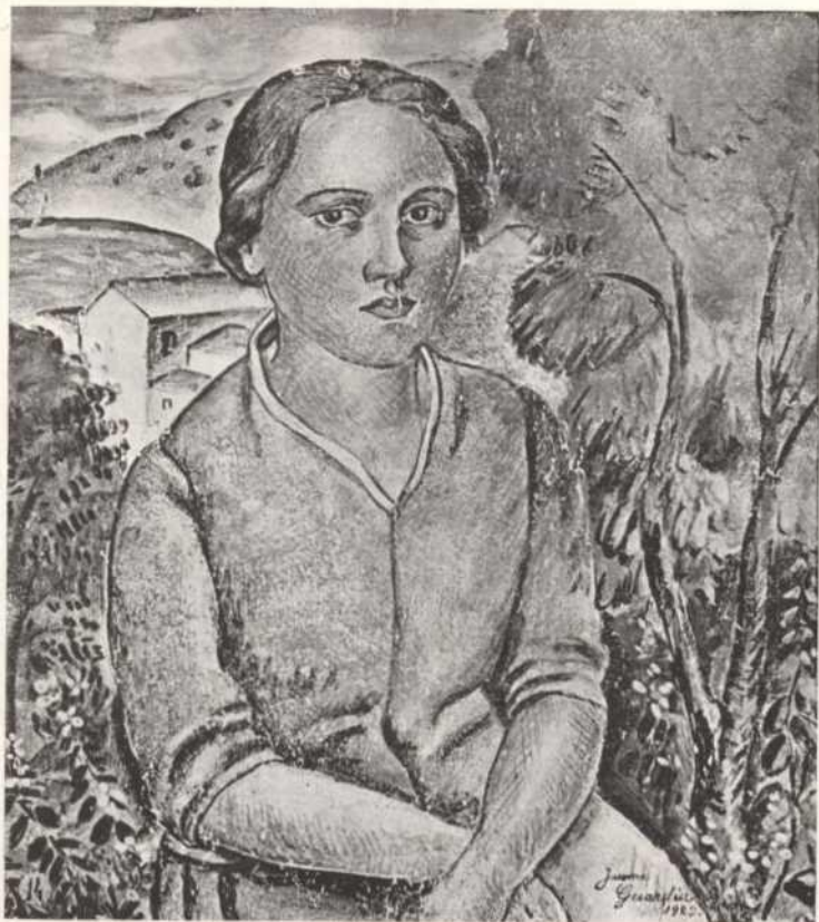
"La Dolors" pintura al fresc de Jaume Guardia