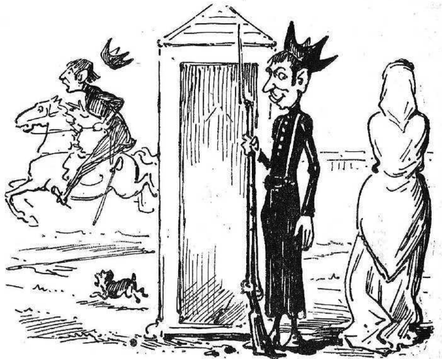
Francament més m' hauria estimat ser capellá de missa y olla.