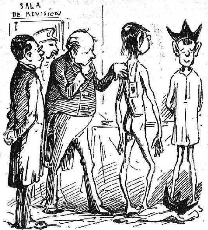
—Jo 'l dono per inútil.... —No, home; ¿no ho veu qu' es un escapulari?...