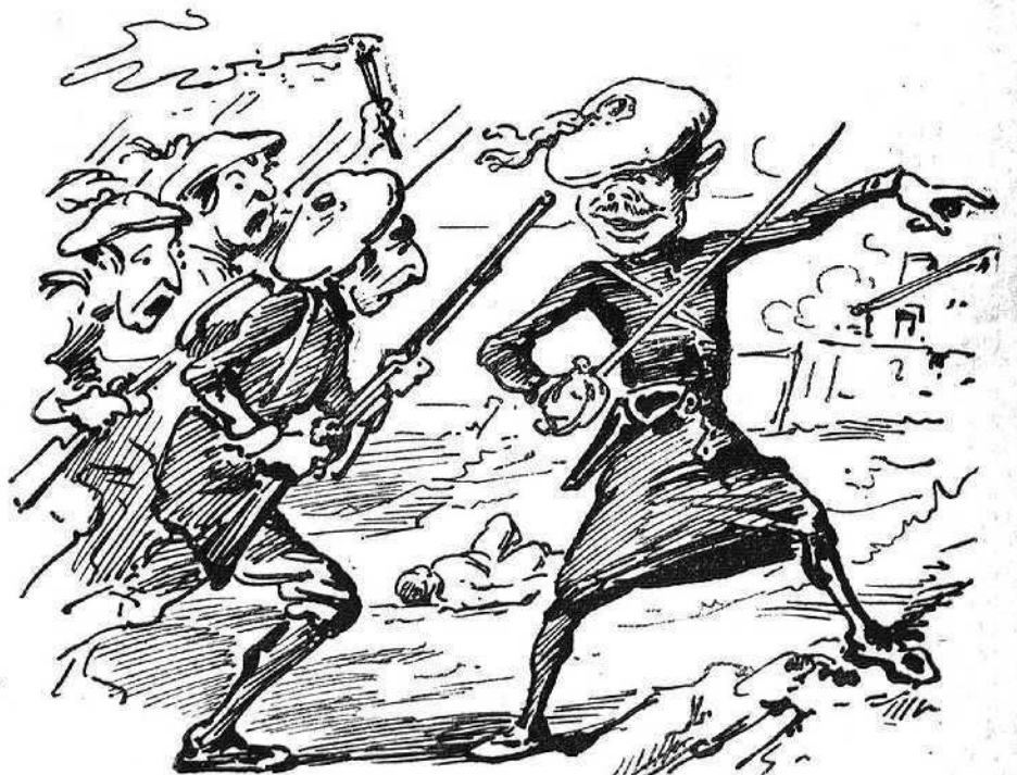
Si no que corrèm perill de que 'l millor dia s' adonan de que poden'ferse cabecillas.