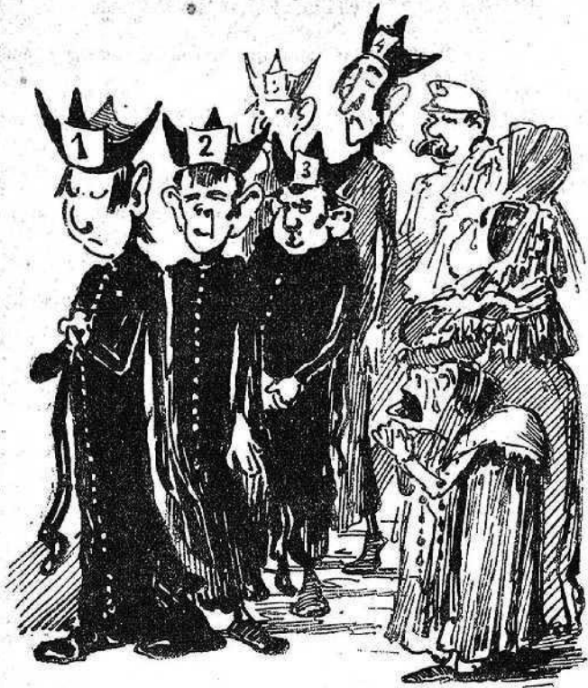
¡Y pensar que s' emportarán lo bó y millor de cada casa!