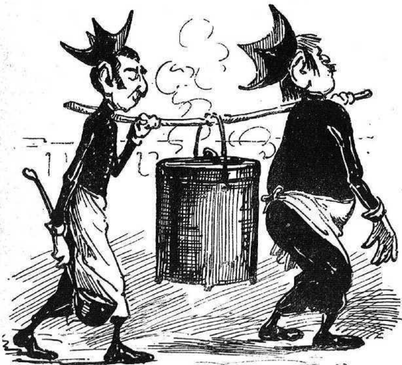
¡Tot es hu tragar l' olla del ranxo ó las canadellas!