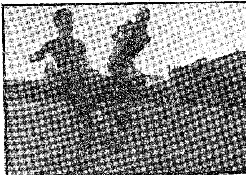
Un shoot de Albaladejo

¿Quiere perfeccionarse como nadador? Lea: "Cómo se debe nadar", por Cuadrada.