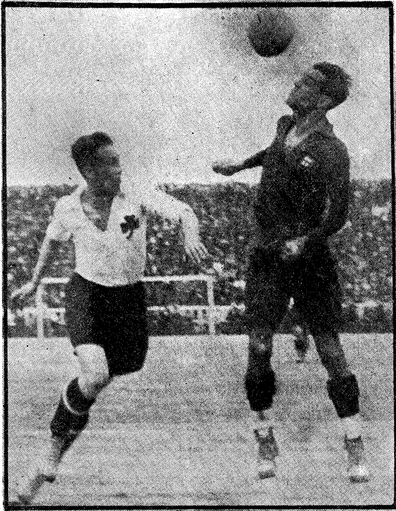
SP. FÜRTH-F. C. BARCELONA

En conjunto, el equipo no dejó de acosar al individuo del bando opuesto, que estaba en posesión del balón, con mayor fe, decisión y fortuna que el día anterior, cuando convino; desmarcaron más hábilmente los componentes para dar mayor efectividad a los pases y estuvieron algo más afortunados en el cuerpo a cuerpo, del cual usaron comedidamente.