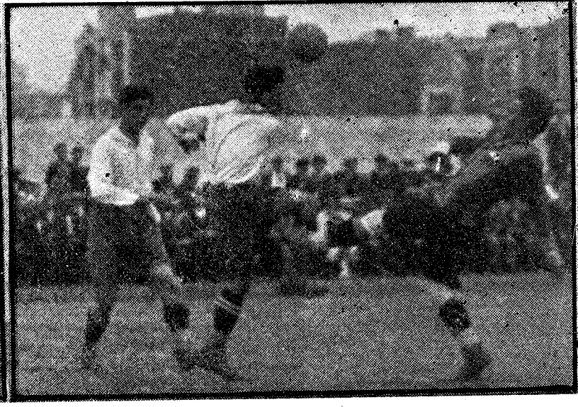
C. D. JUPITER - C. D. EUROPA