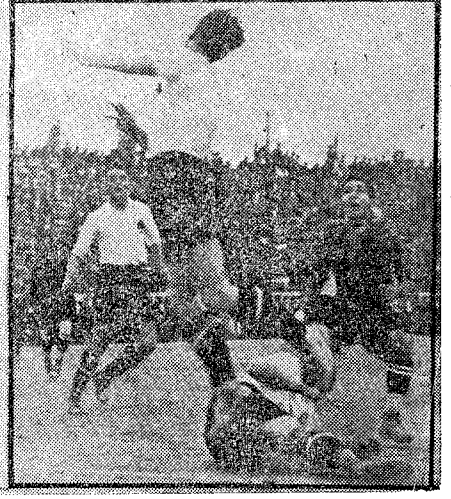
SP. FÜRTH-F. C. BARCELONA Tres momentos de los magnificos partidos jugados por el equipo Bávaro