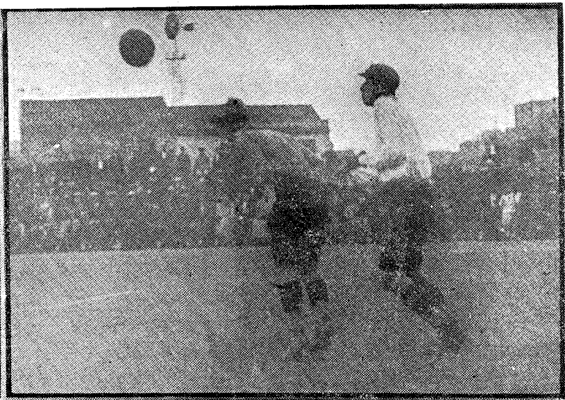
MARTINENC - BADALONA Una cabeza de Bau que interviene antes que Brú llegue al balón Foto Solanes.