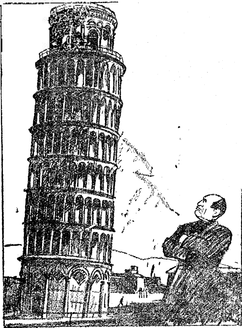
MUSSOLINI DAVANT LA TORRE DE PISA

—Tanmateix és ben estrany: s'aguanta sense el meu suport!