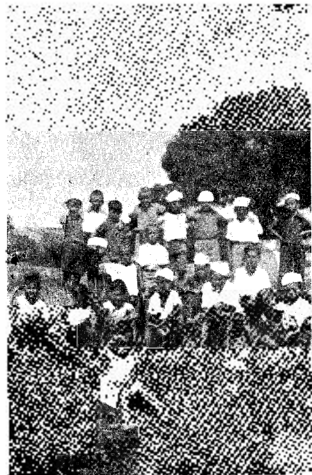
Un descans prop del pi centenari.

El que nosaltres fèiem durant el dia era el següent: a les sis del matí, llevar-nos, rentar-nos, dutxar-nos i fer una mica de gimnàs. Després d'això, jugar a pilota o altres jocs que hi havien, esmorzar,