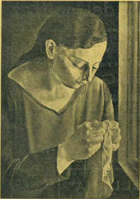
SALVADOR DALÍ. — «NOIA CUSINT».