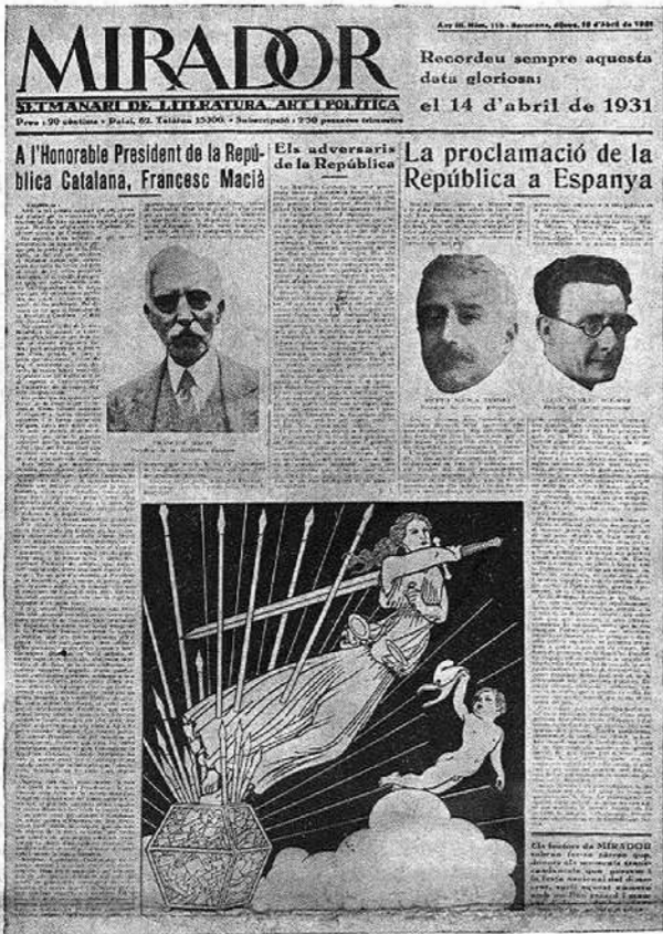
Facsimil de la primera pàgina del número de MIRADOR publicat la setmana del 14 d'abril

ha anat seguint el seu camí ascendent. La col·lecció de MIRADOR constitueix ja un document estimable sobre la vida del nostre país. Totes les idees en curs han estat comentades i debatudes. Els esdeveniments polítics, artístics o literaris, no tan sols de casa nostra, sinó d'arreu del món, hi han quedat registrats. La major part de firmes catalanes han desfilat per les nostres planes; i des de Mirador Indiscret o des d'altres seccions s'han dibuixat les personalitats de l'època actual o passada