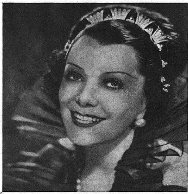
Spinelly en «Nits moscovites»

balla a França, ja és molt diferent. Rapte comença per ésser un film simpàtic per la intenció. El seu realitzador ha fet prova d'un coratge digne de tota lloanca. S'hi veu un esforç dolorós per acomodar-se a un cert gènere literari, titllat d'obscurs per molts, gènere que C. F. Ramuz cultiva amb singular perspicàcia. I el resultat ha estat un film que, tot i ésser bastant avorrit, mereix una consideració atenta.