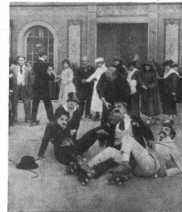
Un dels primers films de Charlot

presari, amb la desimboitura que els caracteritza, i sense pensar-s'hi gens ni mica, sabotegen un d'aquests dos films. El mutilen bàrbarament. Gairebé sempre el film tallat és el de complement. I gairebé sempre aquest és el bo. Els programadors, amb la seva insensibilitat impermeable de consuetud, no s'han donat de la seva qualitat i l'han col·locat abans d'un rave, considerat com a superproducció d'alta vàlua artística. Tant s'ha venut, que importa es la mutilació. I és contra aquesta que cal protestar.