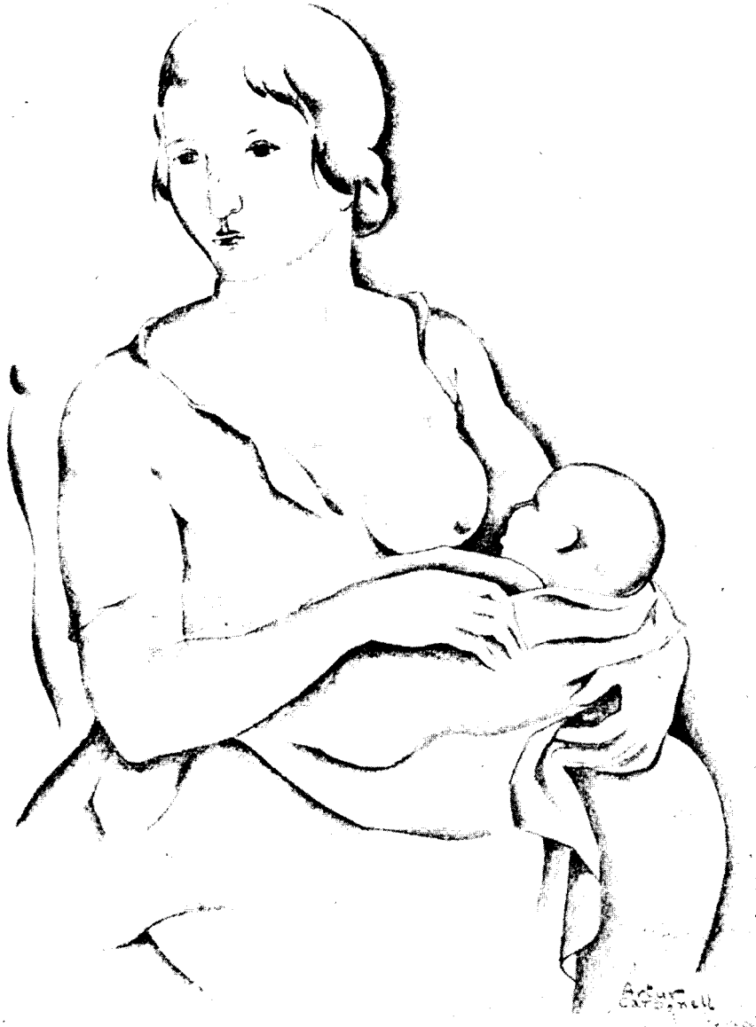
«La mare i l'infant», dibuix d'Artur Carbonell

Des d'aquest punt de mira el tomb, col·lectiu o parcial, ràpid o pausat, de la mentalitat religiosa anglosaxona vers una concepció romana de l'espiritualitat del món, fóra per Anglaterra un bé immens. Al Papat,