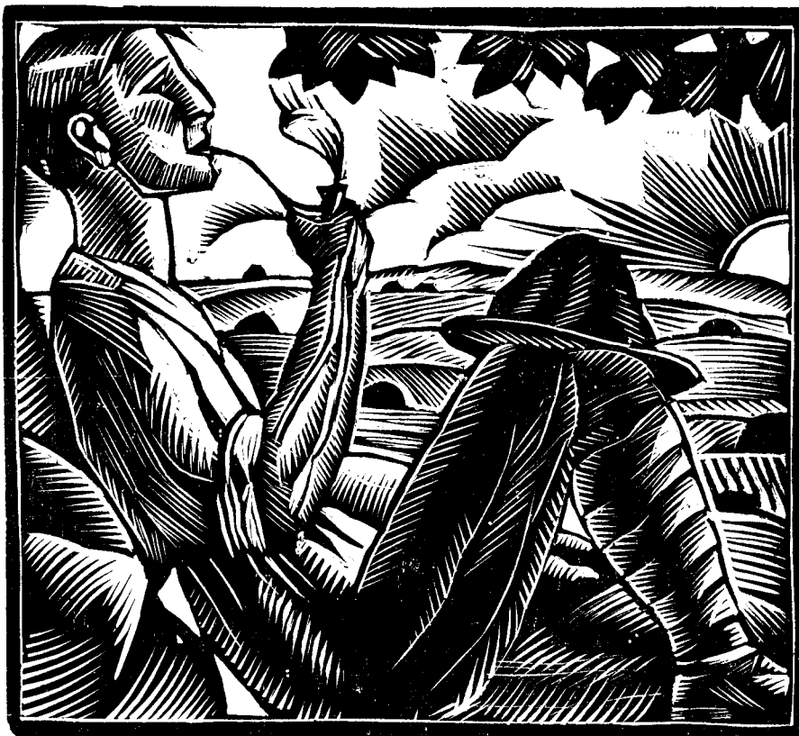
«EXCURSIONISME»: BOIX D'EN CANYELLES (COL·LECCIÓ PRATS)

El temps, en efecte, no fa més que accentuar el terrible malentès que pateixen tant el Sr. Mallol com el Sr. Carles i no fa més que enrarir l'aire del sac dins el qual ells evolucionen. Per a ambdós artistes enamorats d'unes tendències equívokes, l'anti-plasticisme fonamental de les quals ja ningú fora d'ací no ignora, — aquelles tendències que començaren a caducar a Europa en els llunyans temps inefables que veieren la corbata de piquets de M. Fallières fer les delícies del lector bon enfant de les publicacions humorístiques de l'època — per a ambdós artistes,