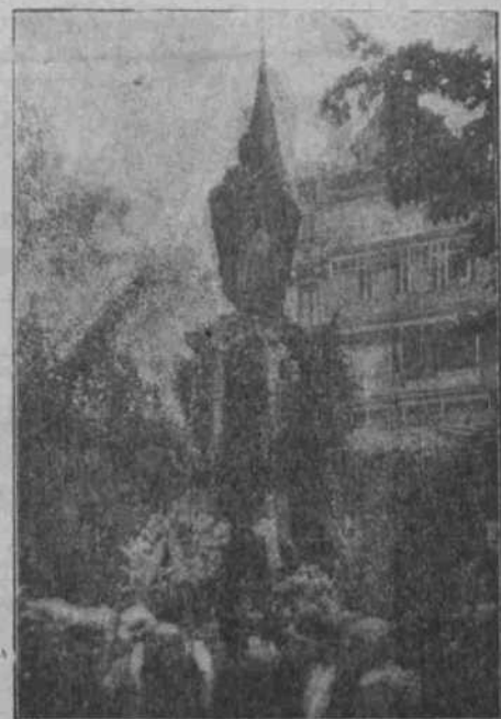
El monument d'En Rafel de Casanova durant l'homenatge d'aquest any (Pot. Casa Cascia)

Que'l pagès va fer mal tracte, i que'l mestre també hi perd? No té res que veure; no li era convenient al primer, sostenir un animal perillós; ni el mestre, sisquera per dignitat, pot continuar en un poble, en el que no se li tributin les atencions degudes.—MIQUEL RIBALTA