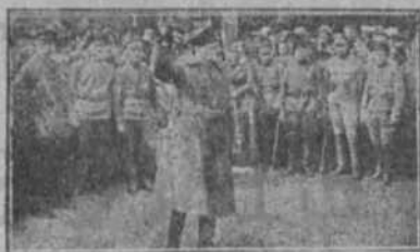
Trotsky arengant als soldats del exèrcit roig.

Sort que els russos estan molt ocupats i amb