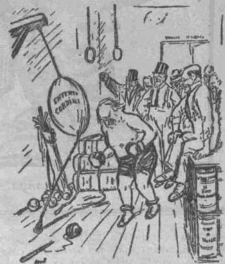
Lloyd George entrenant-se per a no ésser Knock-out en les pròximes lluites