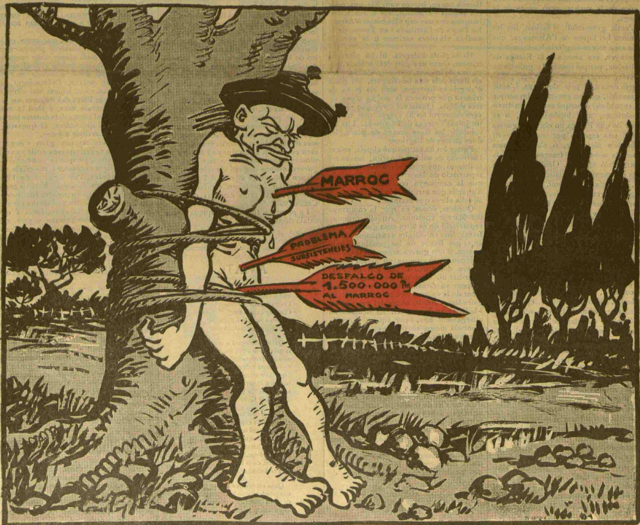
El poble espanyol — Si trobava qui em deslligués les mans, desangrat i tot encara em defensaria!