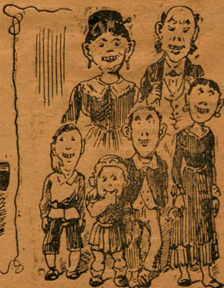
Forasters qu' arriban a Barcelona.