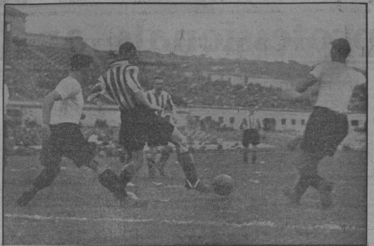
Magnífica figura la del jugador anglès, dominador absolut de la pilota. Mentre dos jugadors catalans s'acosten, ell, serà i segur de les seves facultats, prepara la passada, que anirà, matemàtica, als peus o al cap d'un company d'equip