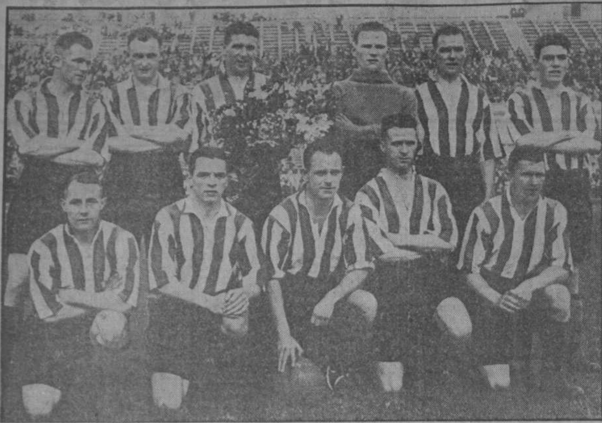
Heus ací el formidable equip del Sunderland, que tan magnífica exhibició efectuà ahir a l'Estadi de Montjuïc. Equip integrat per veritables mestres del futbol dels quals hom no sap quin particularitat admirar més. Esportius nobles, admirables, que voldriem veure més sovint pels nostres camps