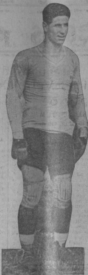
NOGUES fou la "víctima" més visible i la més injusta de la magnífica actuació dels "pross" britànics.