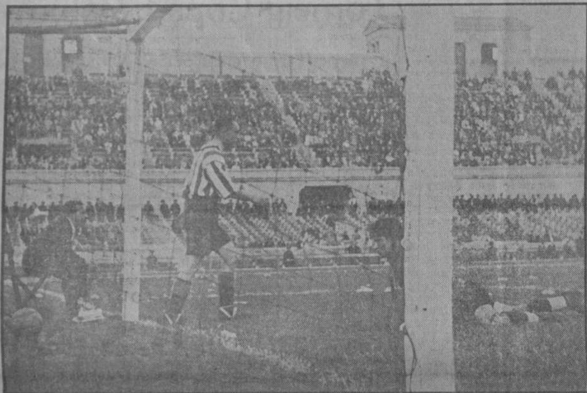
Un dels gols marcats pel Sunderland. Nogues s'ha llançat magnífic i ràpid, però impotent — batut ja — a evitar el punt. La pilota és ja dintre la xarxa, mentre el davanter anglès, sense perdre la serenitat, com aquell que no ha fet res, se'n torna a seu lloc...