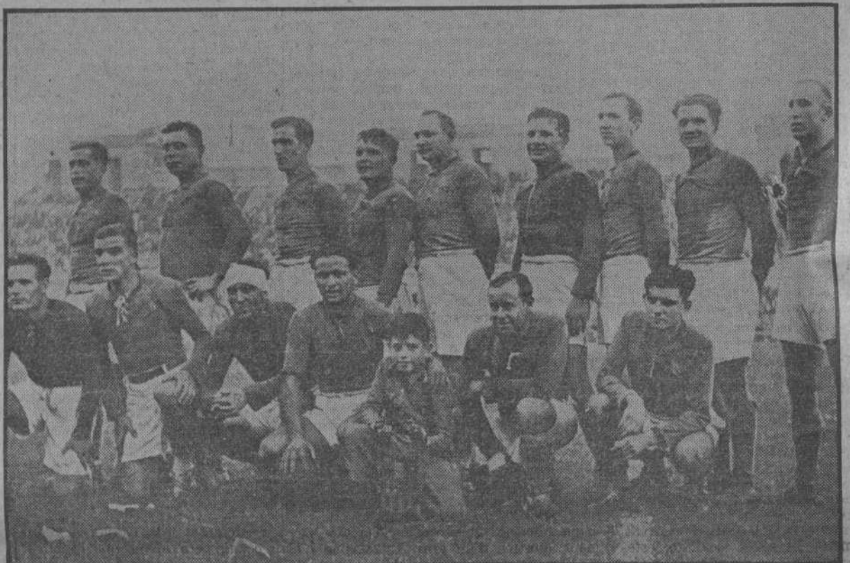
Equip de rugby del F. C. Barcelona, que abans del partit Sunderland-Selecció Catalana disputà la Copa Catalunya al Cornellà, que resultà batut per 16 punts a 7